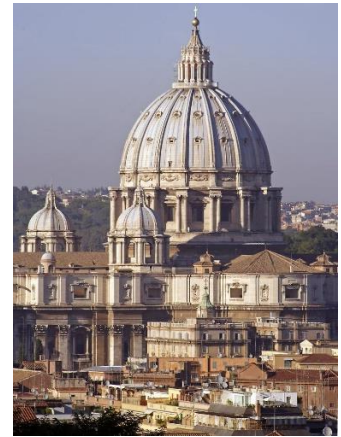
Petersdom in Rom