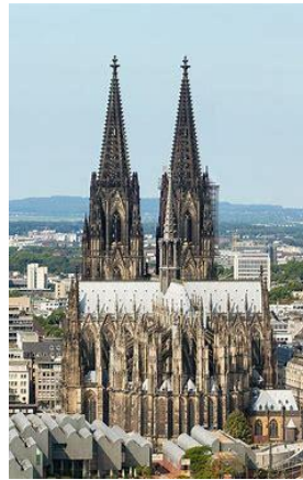
Kölner Dom in Köln