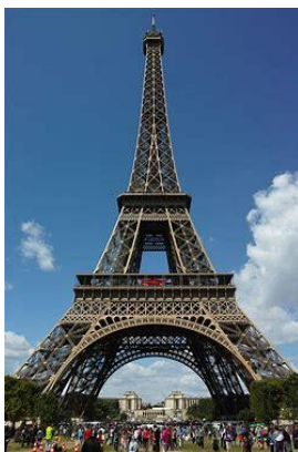
Eifelturm in Paris