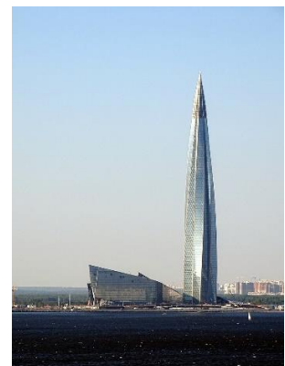
Lakhta Center in Sankt Petersburg