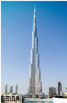
Burj Khalifa in Dubai

Interessanterweise sind die Menschen auch heute noch daran interessiert, sehr hohe Gebäude zu bauen. Schätz mal, wie hoch diese Gebäude sind. Du darfst auch ins Internet schauen: