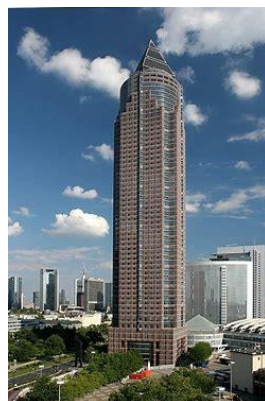
Messeturm in Frankfurt